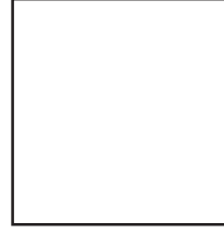
इच्छाइएको व्यक्तिको फोटो

इच्छाइएको व्यक्तिको लेखात्मक वा रेखात्मक सहीछाप ..... (फोटोमा समेत पर्ने गरी)